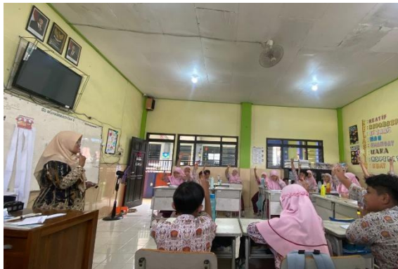
Gambar 2. Observasi Kelas

“Kalau aku pegang bonekaku, aku ingat bau sabun mama waktu aku kecil... aku tulis ‘bonekaku wangi sabun colek yang selalu membuatku tenang’.” (Wawancara, Siswa A, 10 tahun).