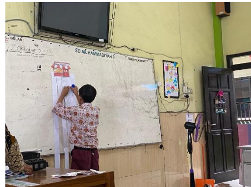
Gambar 2. Praktik Menulis Teks Deskripsi

PjBL sebagai Wadah Integrasi Kognitif-Afektif-Psikomotorik Sintaks PjBL (stimulus → eksplorasi multisensori → elaborasi kelompok → presentasi → refleksi) menciptakan alur yang memungkinkan emosi diekspresikan secara bertahap dan aman (Cahyani & Budiastra, 2025). Tahap presentasi individu menjadi momen katarak emosional: 24 dari 28 siswa menangis haru atau tertawa bahagia saat membacakan tulisannya di depan kelas. Ini menegaskan bahwa PjBL berbasis pengalaman personal meningkatkan self-disclosure emosional secara signifikan pada anak SD.